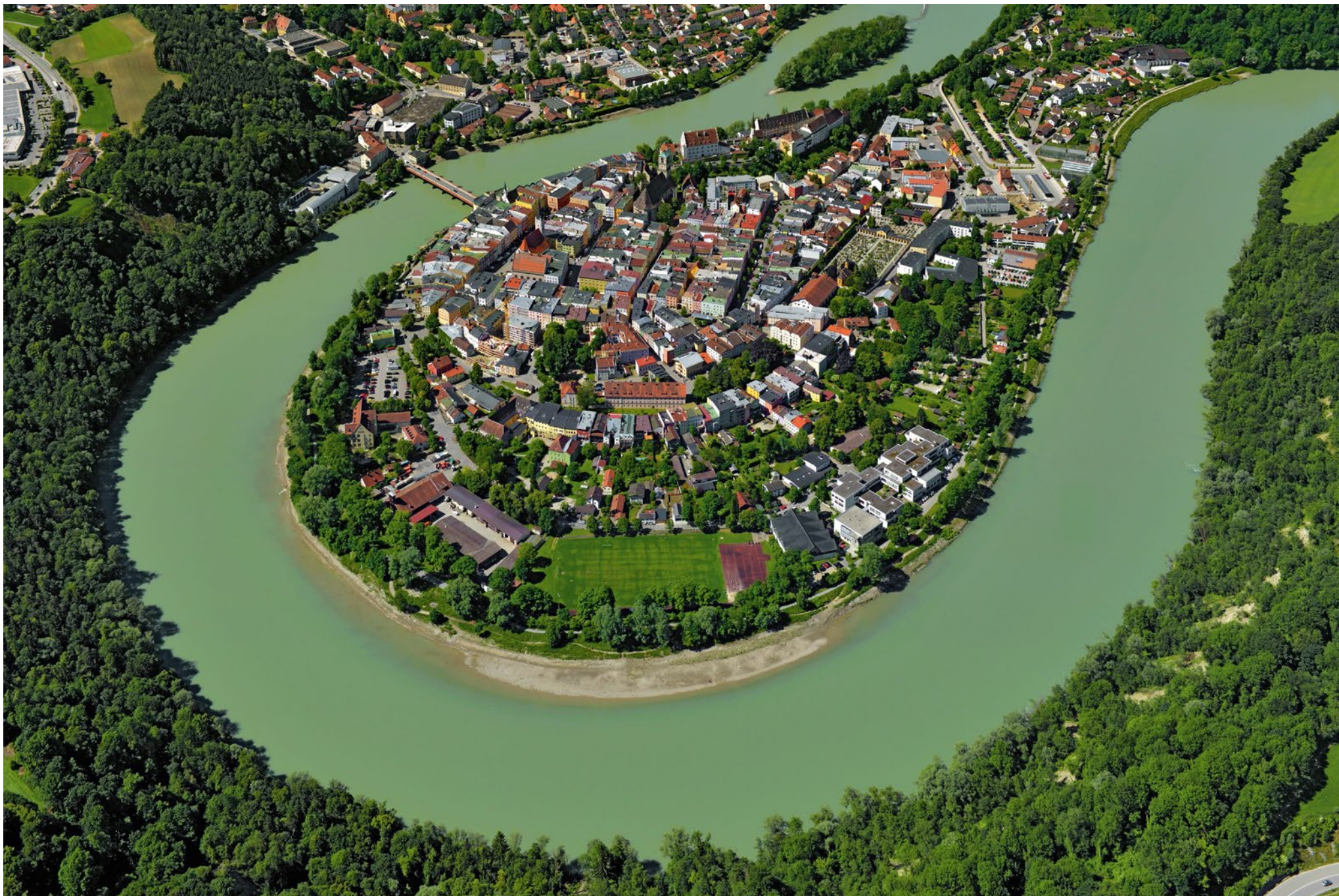
Wasserburg am Inn