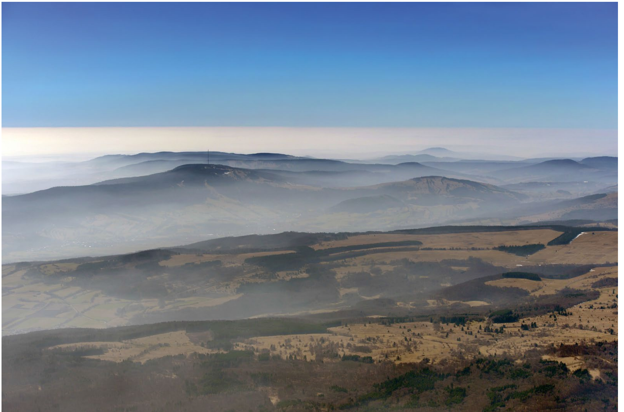
Rhön mit Kreuzberg