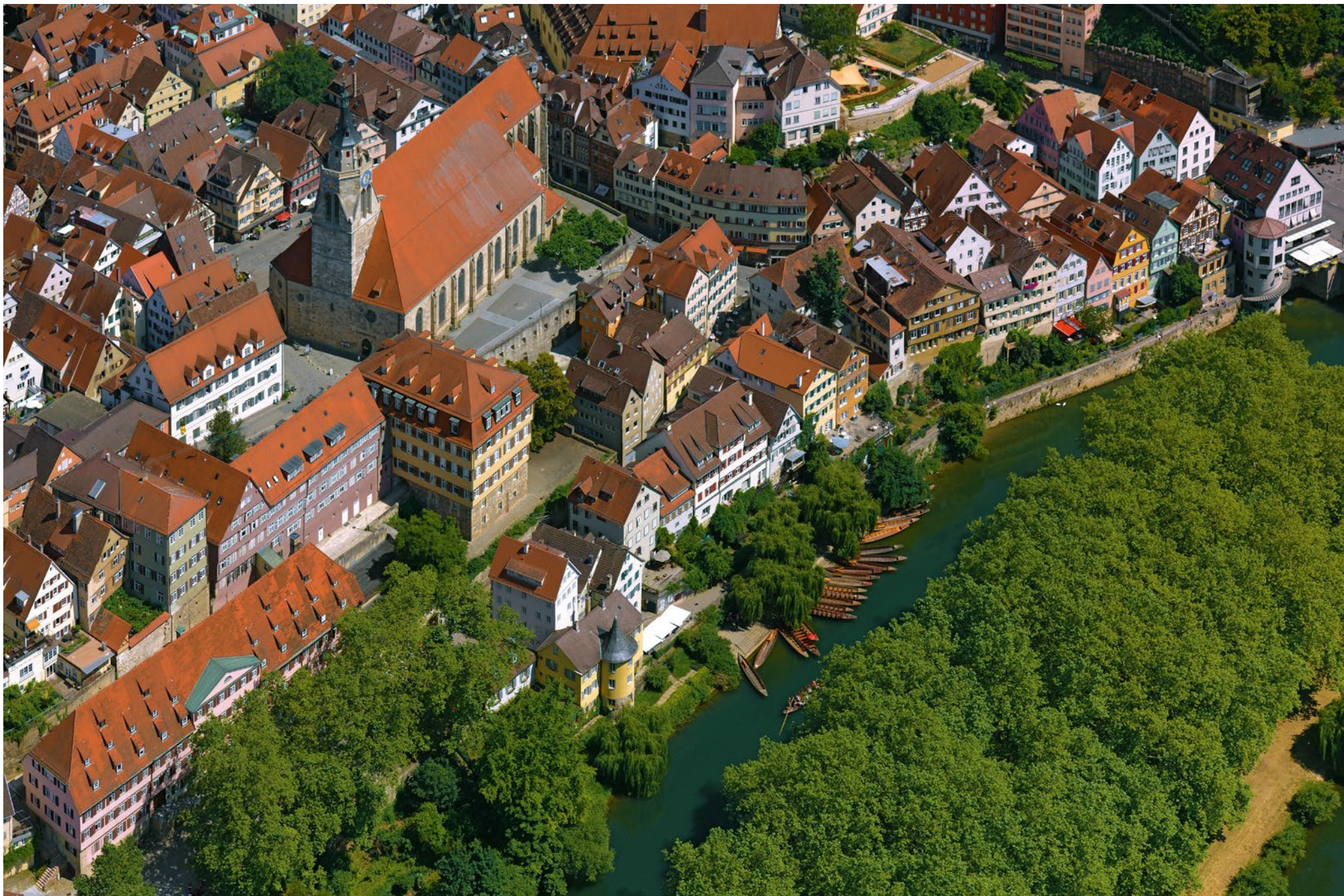
Tübingen am Neckar