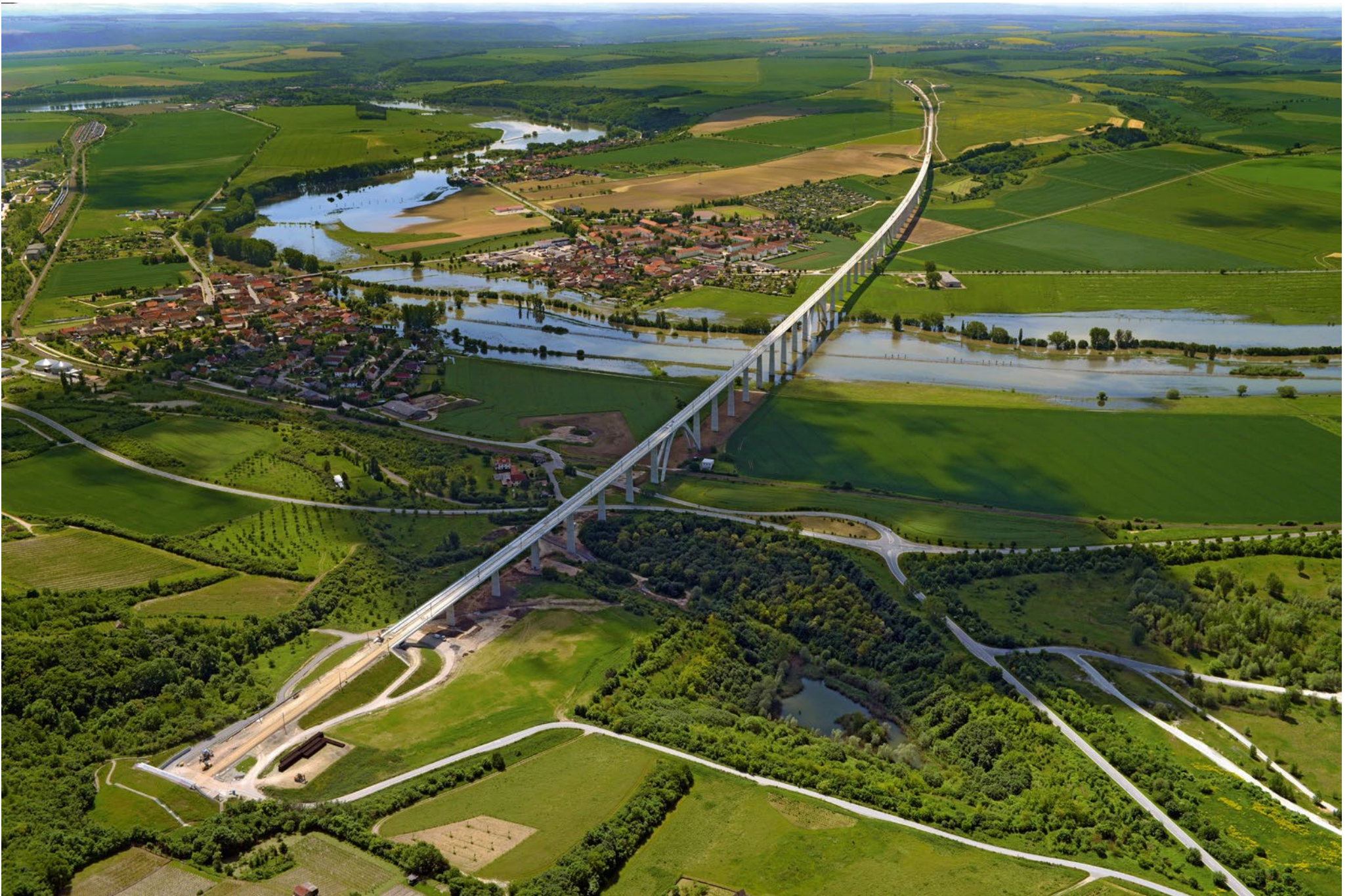
Unstruttalbrücke ICE-Neubaustrecke Erfurt-Leipzig/Halle