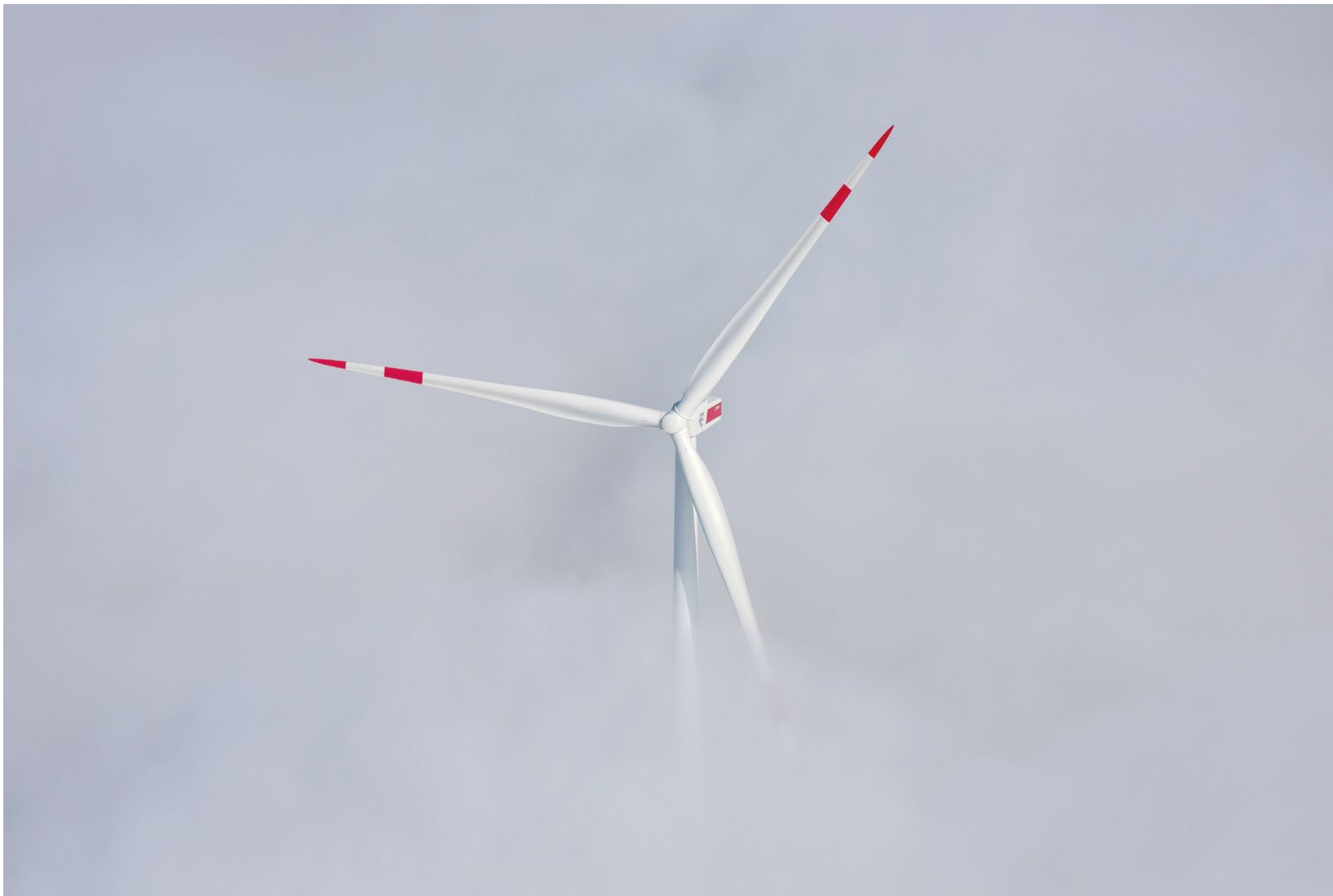
Windrad im Bodennebel