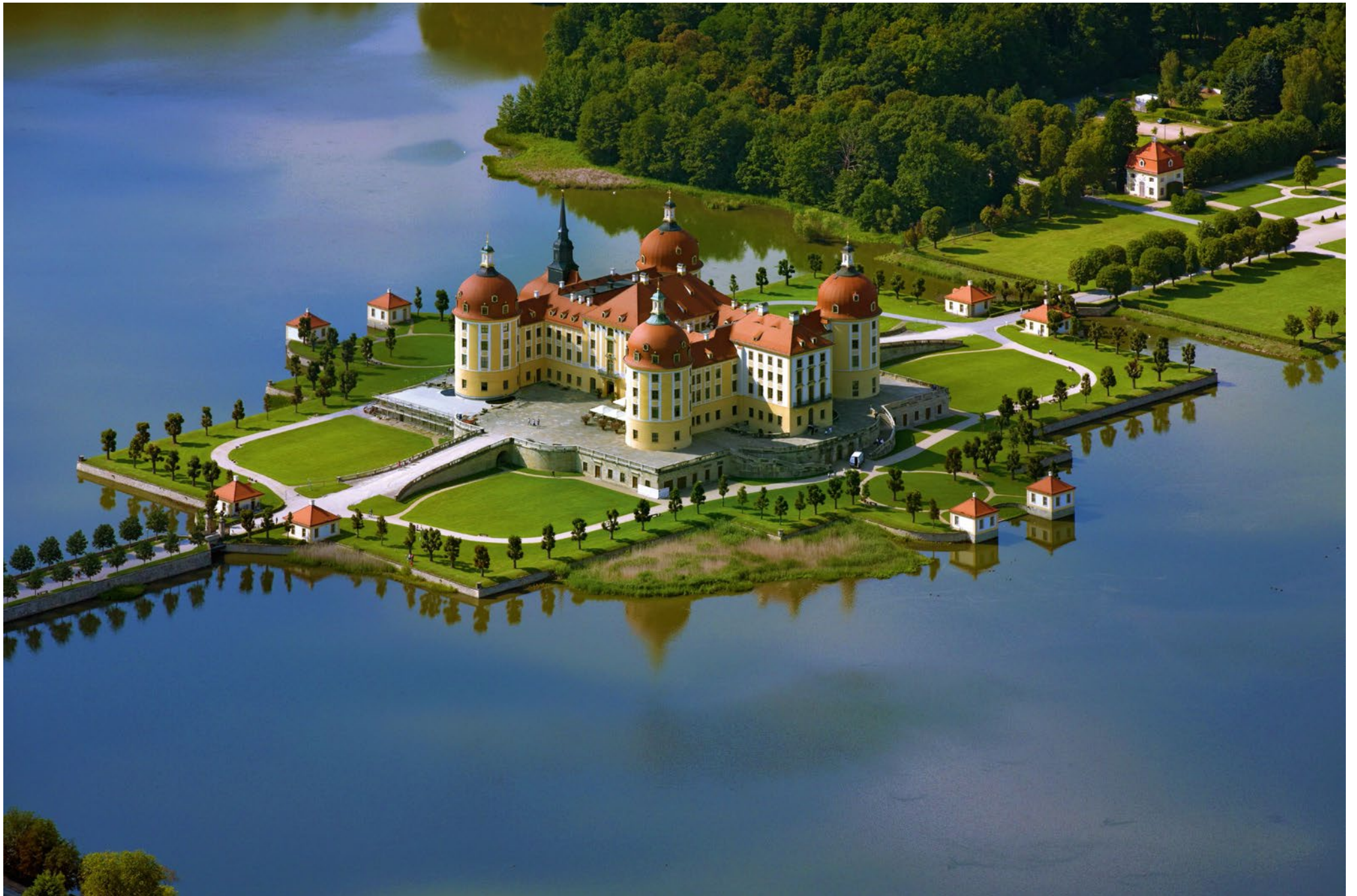
Schloss Moritzburg bei Dresden