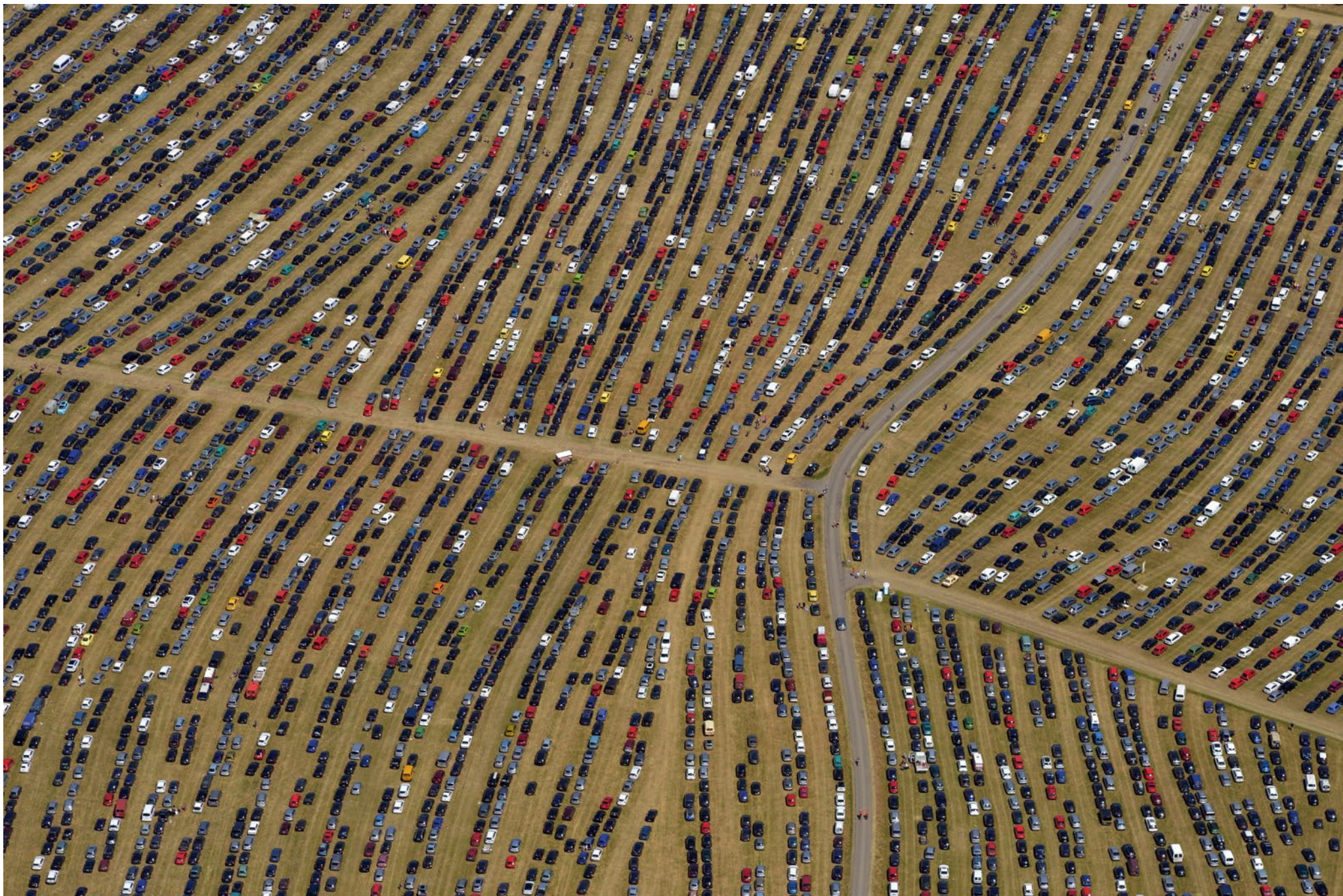
Southside-Festival Neuhausen ob Eck, Parkplatz