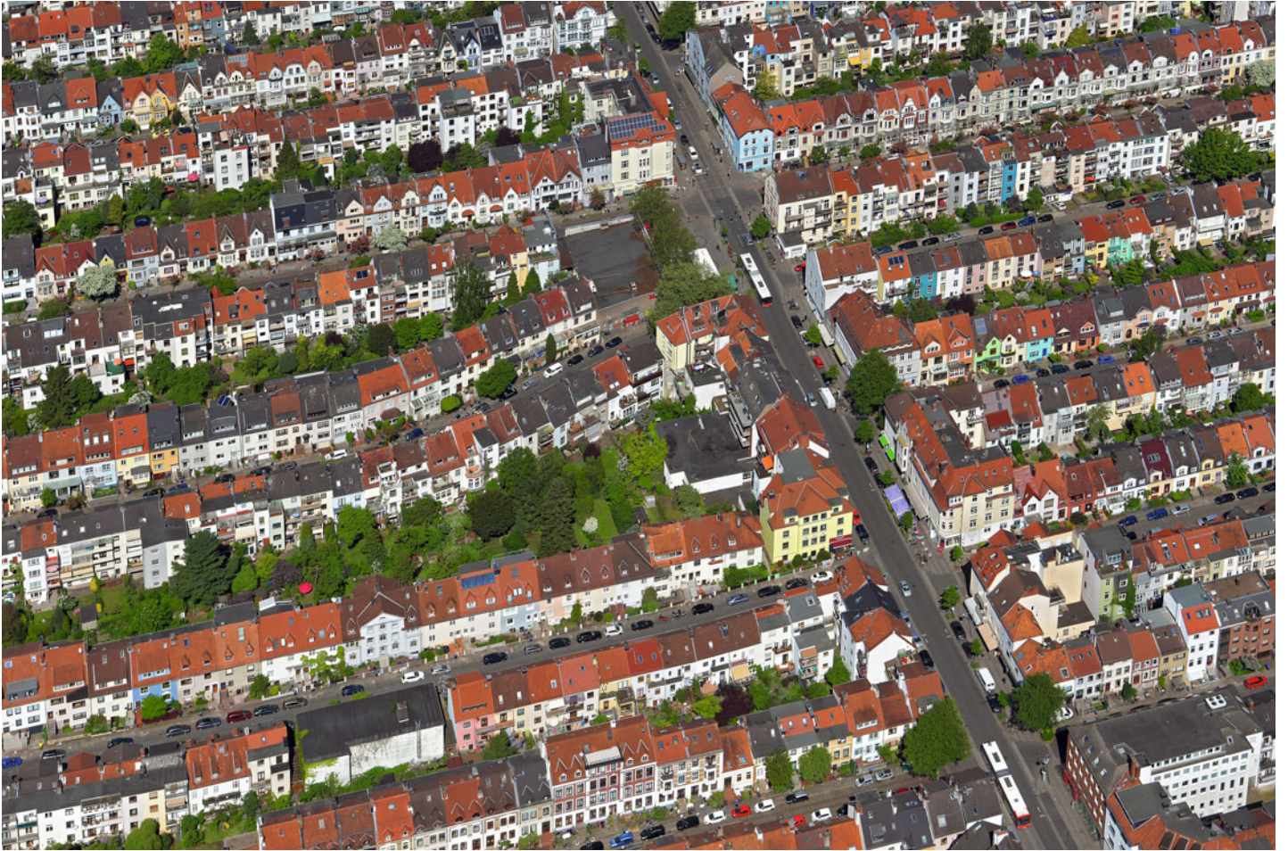
„Flüsseviertel“ in der Bremer Neustadt