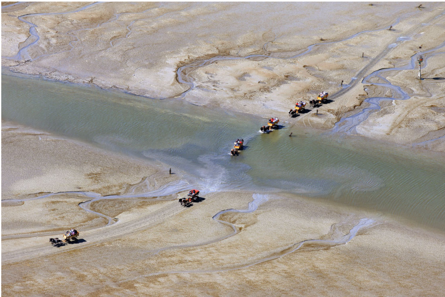
Wattfahrt nach Neuwerk