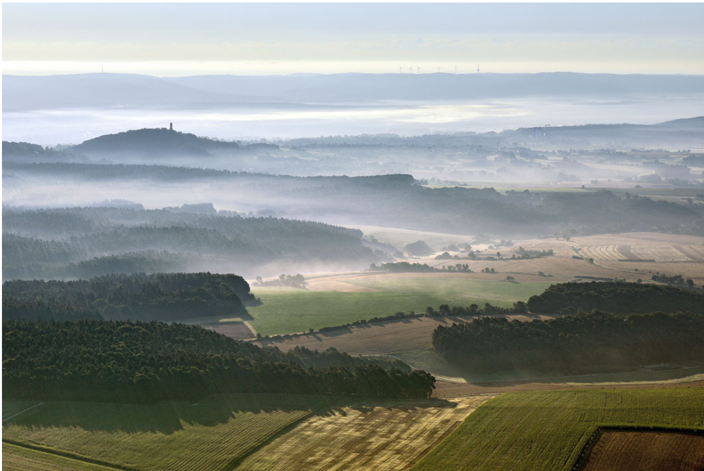
Morgennebel bei Bamberg