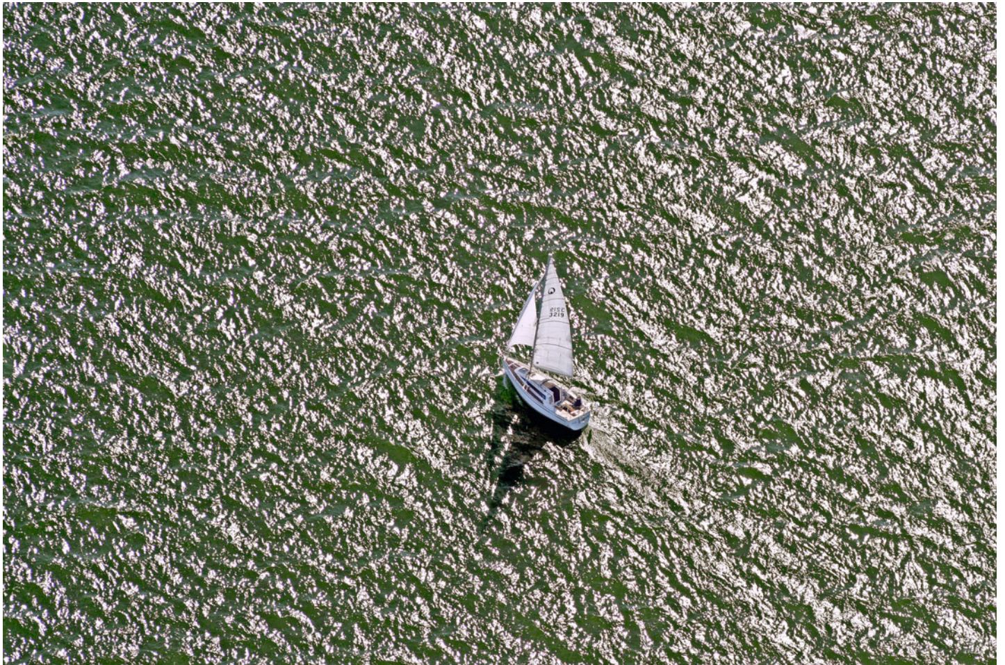
Segelschiff auf dem Chiemsee