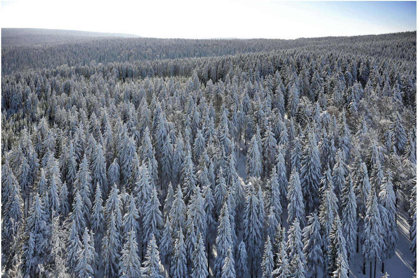
Winterlandschaft im Thüringer Wald