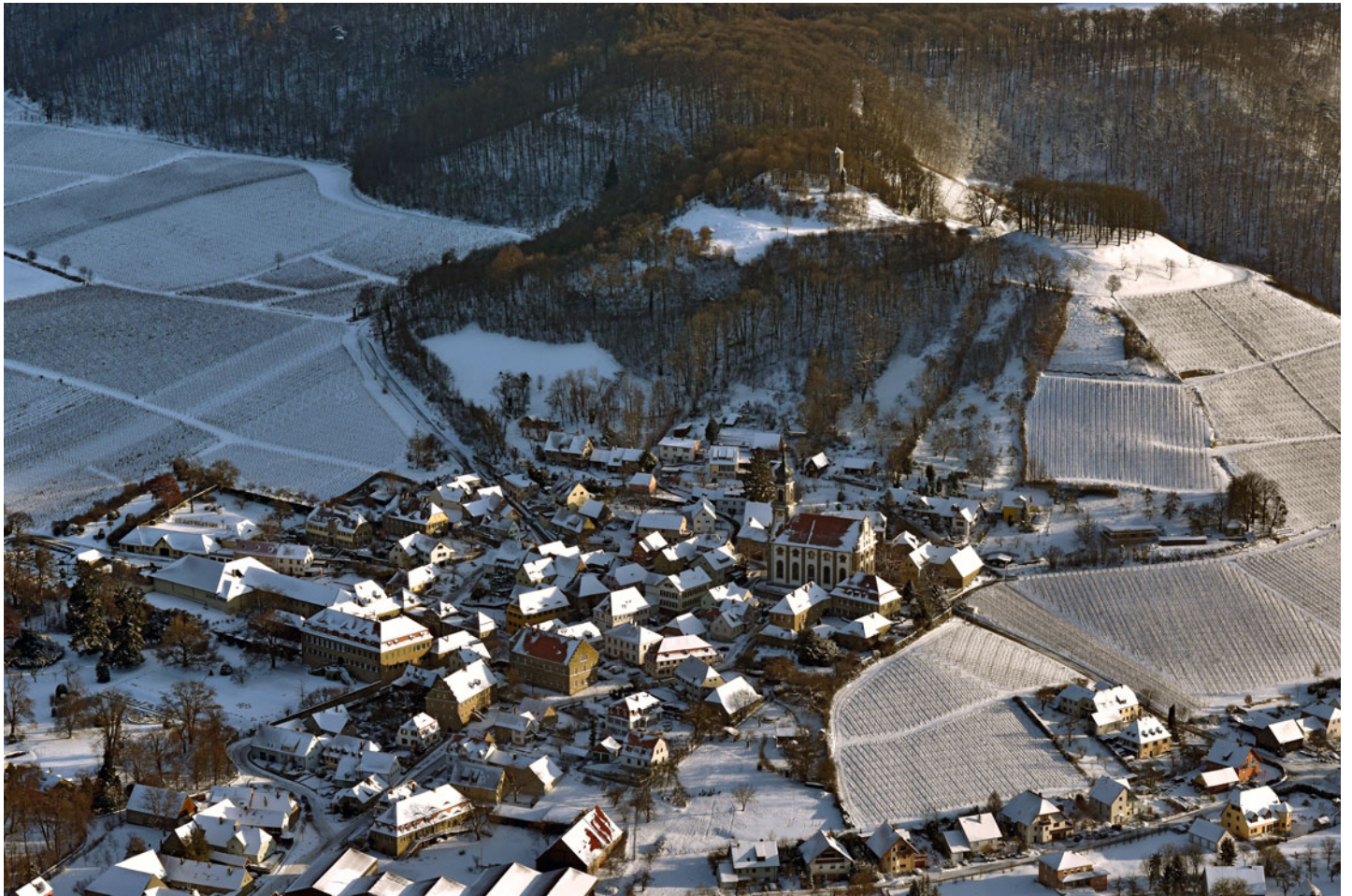
Castell im fränkischen Weinland