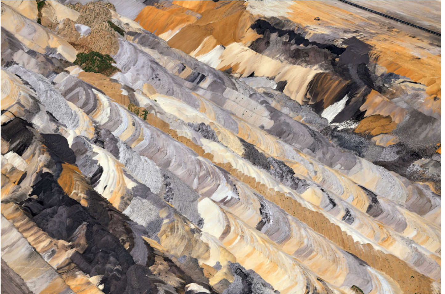
Abraumhalde Tagebau Inden