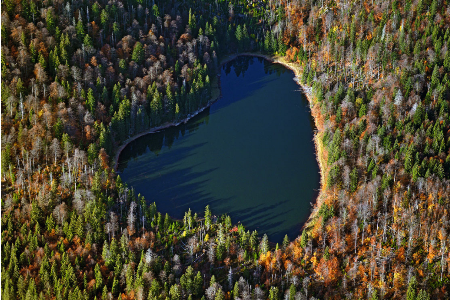
Rachelsee im Bayerischen Wald