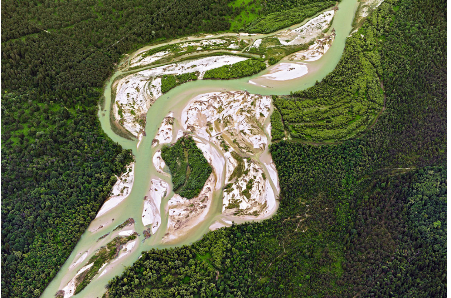
Isar in der Pupplinger Au