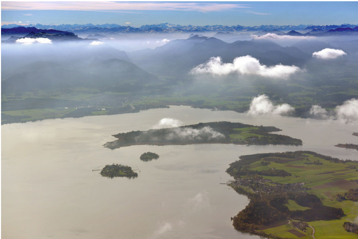
Blick über den Chiemsee